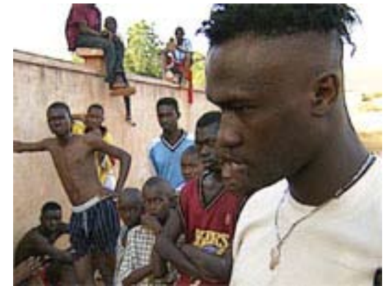
aus: Taxi nach Afrika, Deutschland 2000

Online: www.stube-bayern.de per Fax: 0911-36672-19 per Post: STUBE Bayern Lorenzer Platz 10 90402 Nürnberg